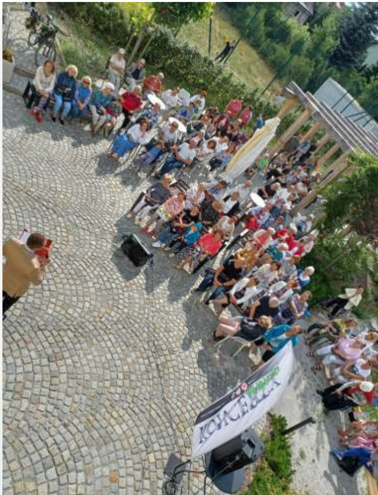
Koncerty na świeżym powietrzu