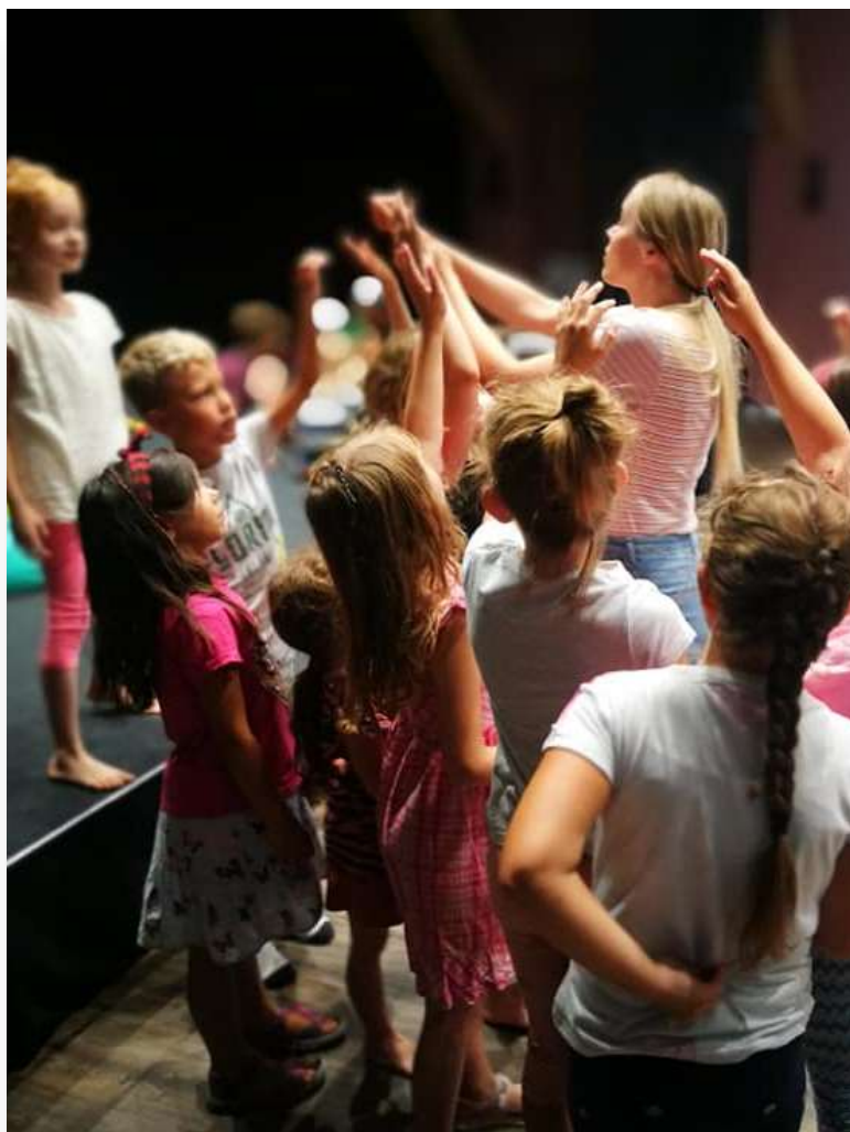
DZIECI I MŁODZIEŻ