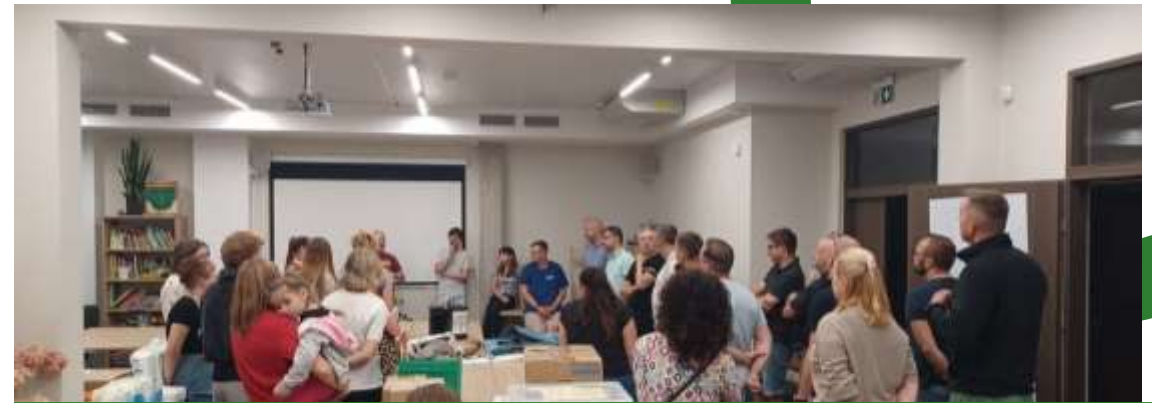
Solidarność: Wolontariat i wspólne działanie