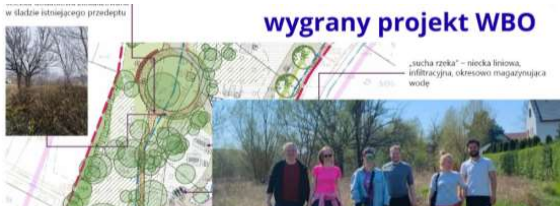
Realny wpływ: Wygrany projekt WBO zainicjowany przez akcje sąsiedzkie