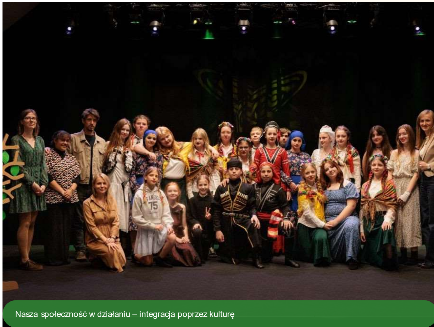
Nasza społeczność w działaniu – integracja poprzez kulturę