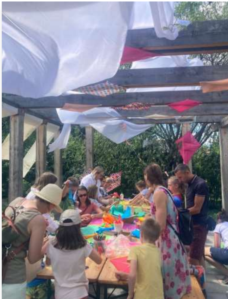
Warsztaty kreatywne w ogrodzie