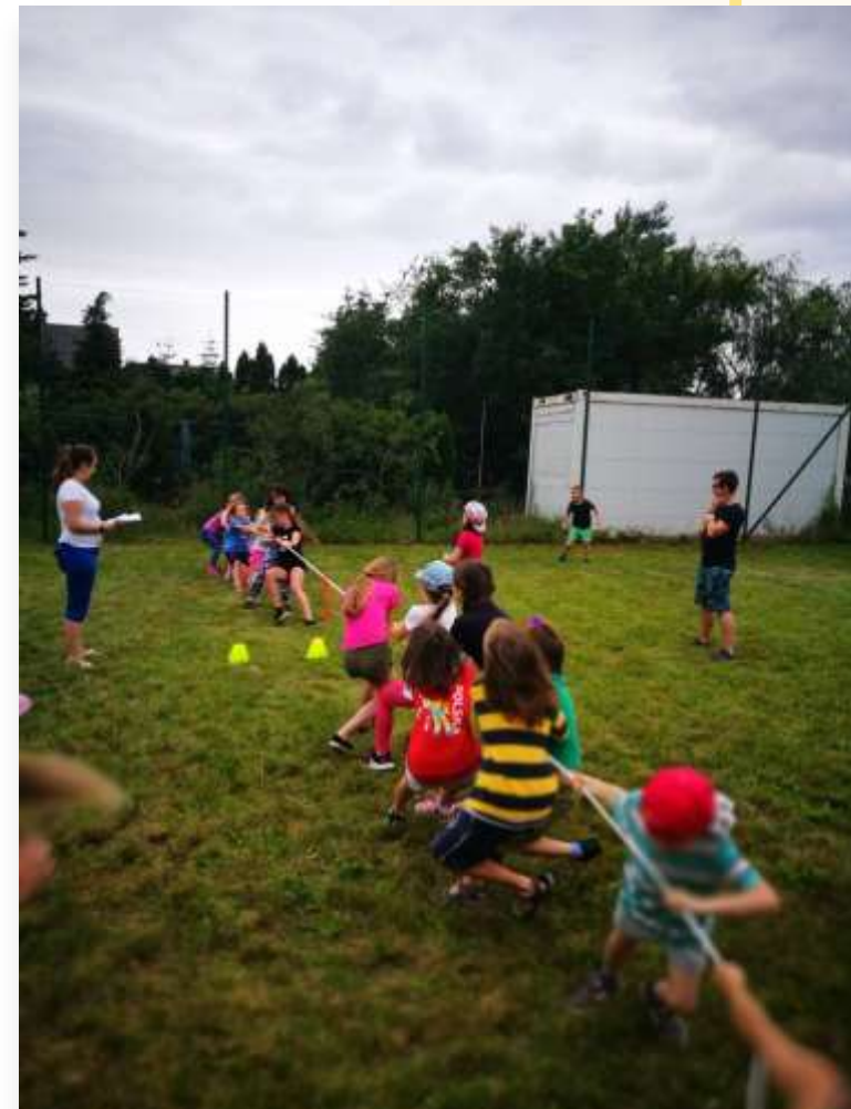
Aktywność sportowa na boisku