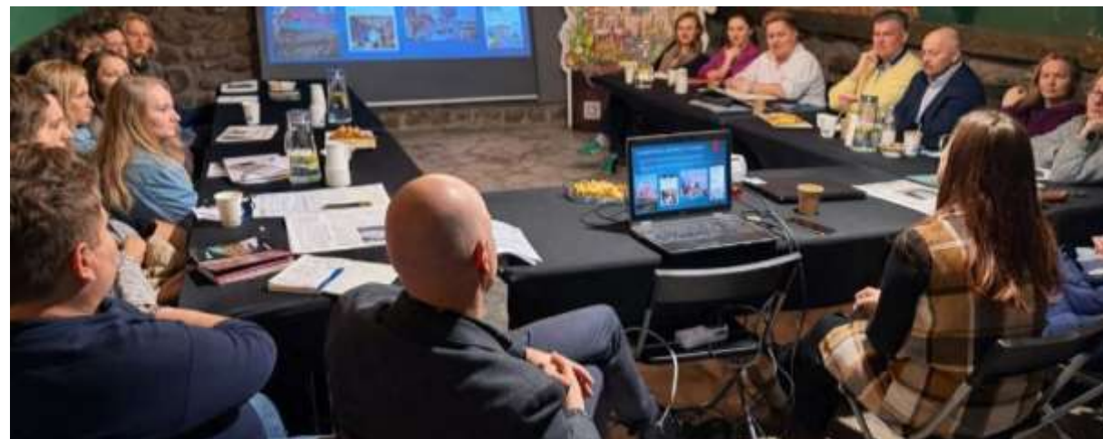
Spotkanie Partnerstwa w historycznych wnętrzach OPT ZAMEK, budujące relacje i wspólne plany działania