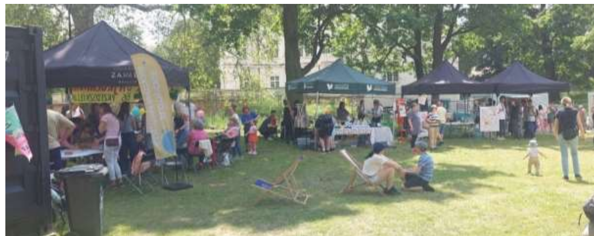
Festyn osiedlowy jako przykład konkretnego działania realizowanego wspólnie przez Partnerstwo dla mieszkańców